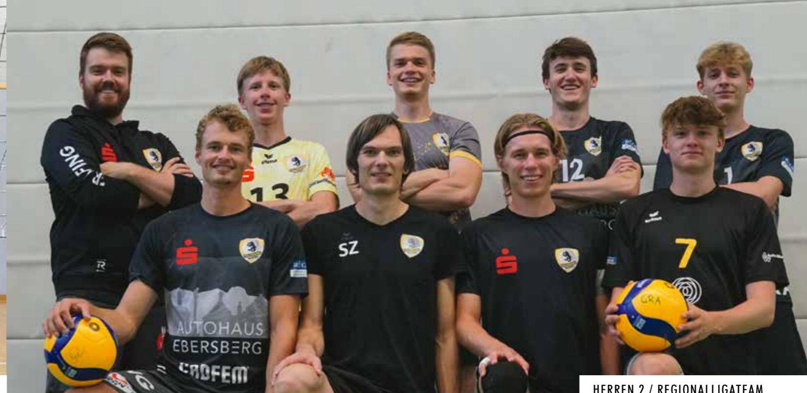
HERREN 2 / REGIONALLIGATEAM