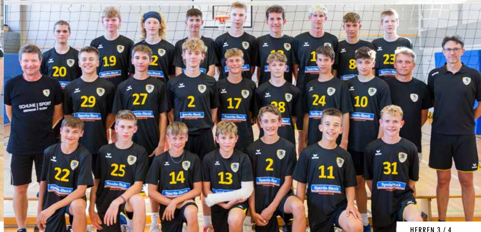
HERREN 3 / 4